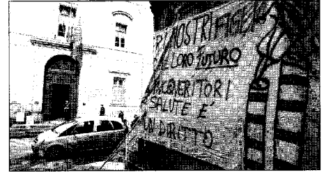
Le foto della protesta ambientalista di ieri mattina e un momento della discussione politica nel consiglio provinciale riunitosi nella sede di piazzale Morgagni